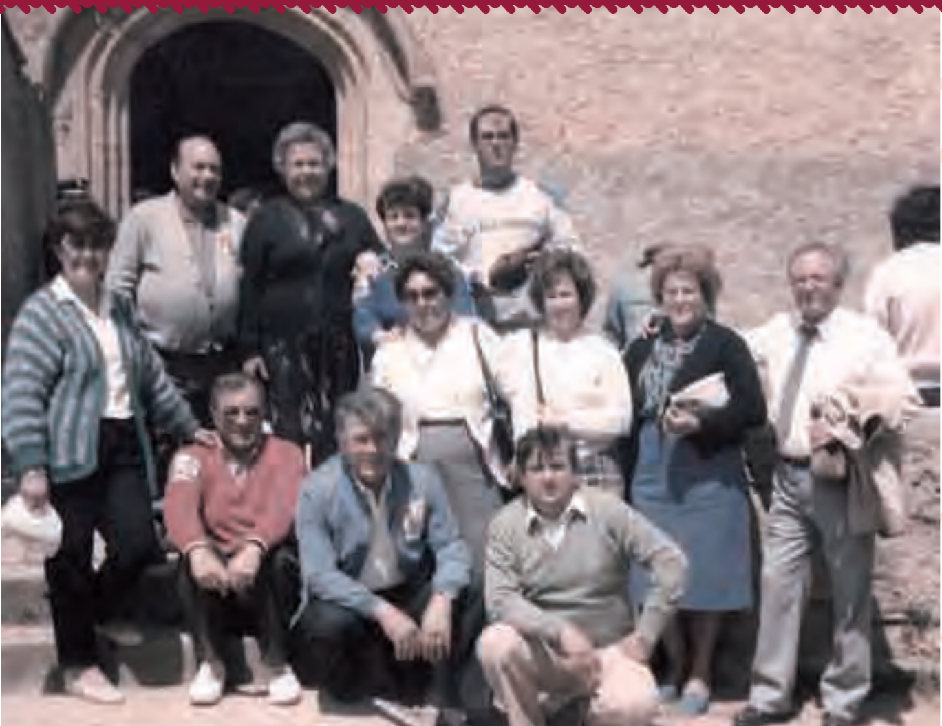
<< Fiestas de Patiño ^^ Sabadell 1986