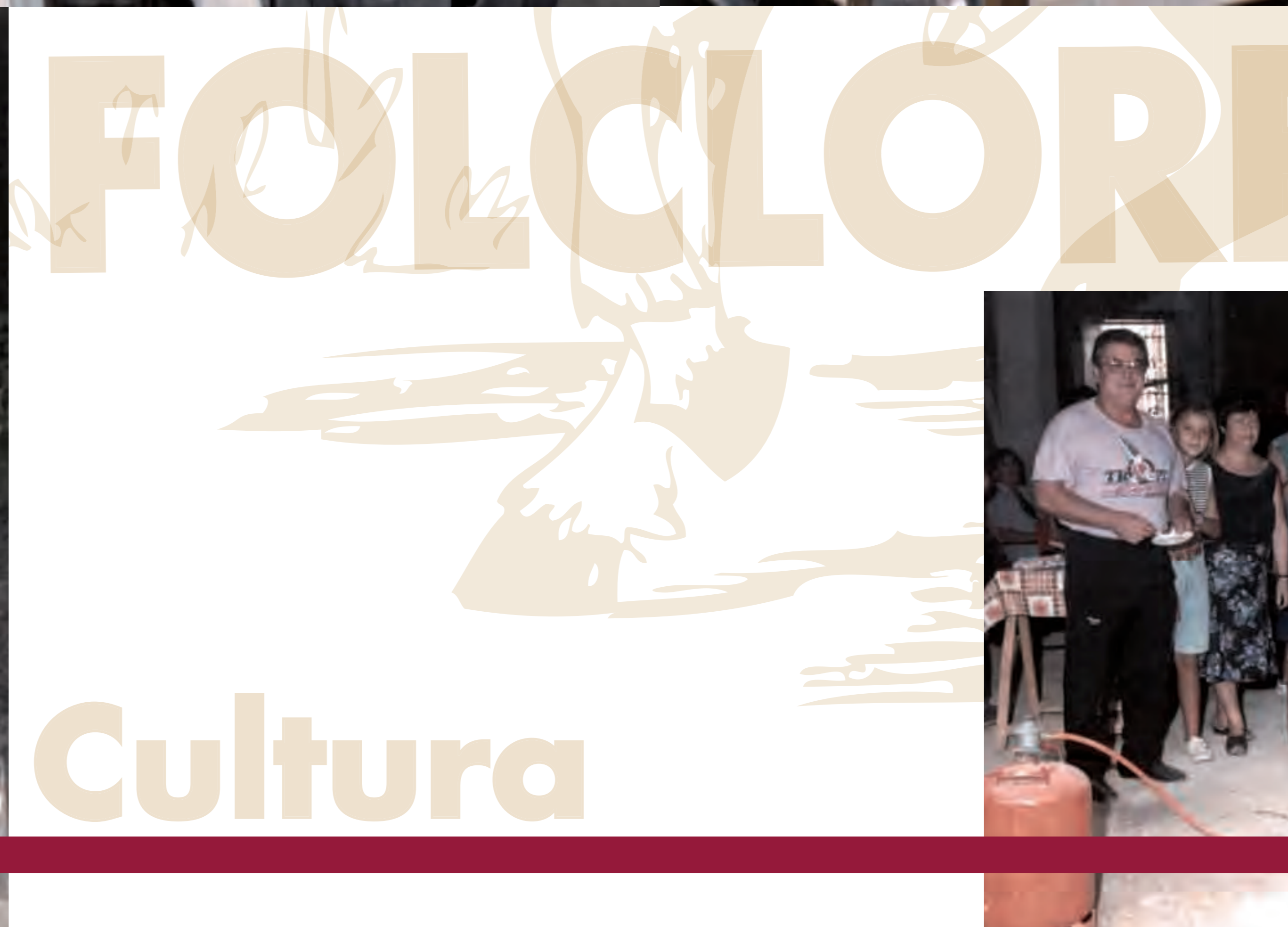
vv Fiestas de Patiño 1990