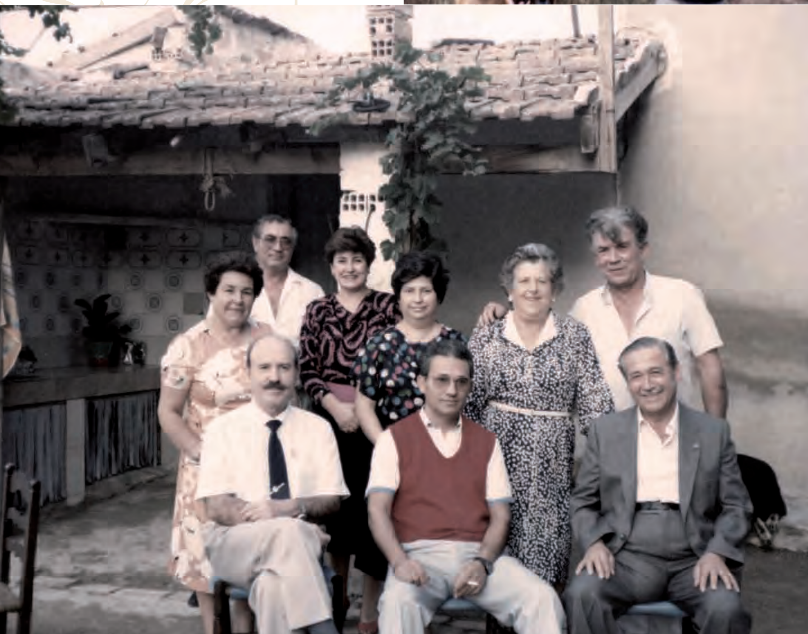
vv Salamanca 1993